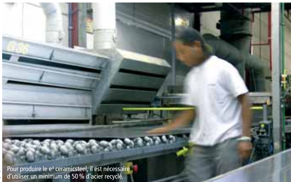
Pour produire le e 3 ceramicsteel, il est nécessaire d'utiliser un minimum de 50 % d'acier recyclé.